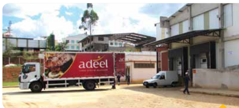
Diversos empregos foram criados na cidade

Apesar de ser uma empresa nova no mercado, a Adeel Alimentos já é uma referência na produção de carne suína em Pará de Minas e outras cidades do Brasil.