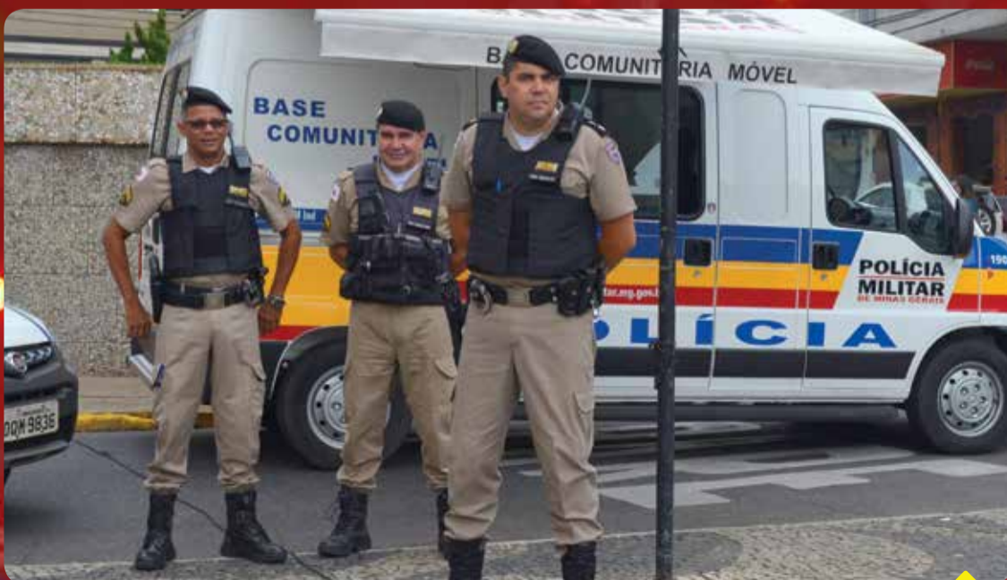
Uma unidade móvel vai ficar disponível para a população no Centro da cidade

Lançamento da "Operação Natalina" deu início aos trabalhos de prevenção aos crimes