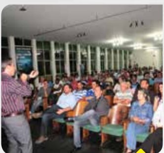
O salão do Sindicato ficou lotado

Na noite de 18 de novembro, foi realizado pela CooperOeste o III Seminário Rural de Pará de Minas, que neste ano apresentou o tema "Como a Nutrição Aumenta a Lucratividade". O evento consistiu na apresentação de duas palestras, que foram ministradas pelos profissionais contratados pela empresa.