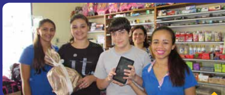
Os ganhadores da promoção ao lado da equipe da Papelê

A loja entregou prêmios a dois estudantes que fizeram suas compras para o ano escolar