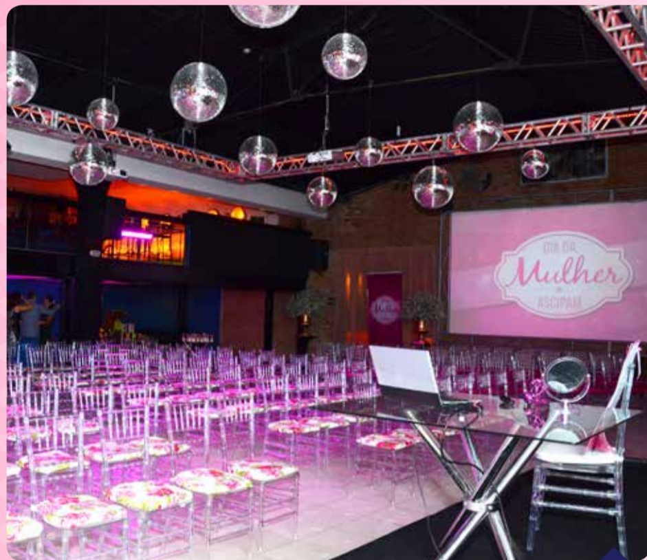
O espaço foi cuidadosamente decorado para o momento