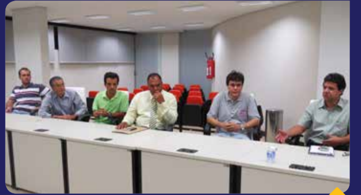
Comissão estará presente em todas as reuniões

Uma comissão formada por diretores da Ascipam acompanhará o trabalho do Legislativo