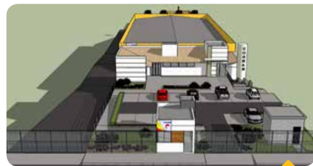
A planta do novo espaço conquistado pela Cogran

grande novidade, que representa um marco na história da indústria: a implantação de uma nova unidade, a Alimentos Cogran, que vai industrializar a carne suína, "Será uma indústria moderna, que já está sendo construída, e a previsão é que iniciemos as atividades no início de 2016", adianta o gerente