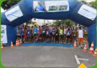
Diversos atletas compareceram ao evento

Associação foi parceira da Corrida Sicoob Ascicred, que reuniu centenas de atletas