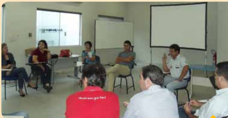
Reunião contou com a participação de associados locais

A proposta recebeu o nome de "Ascipam mais próxima do associado" e tem o objetivo de ouvir os empresários, abrindo as portas da associação e dando oportunidade para dúvidas e sugestões, além de saber como a associação pode ajudar seus associados.