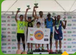
Evento contou com a participação de corredores até de outros estados

Foi um grande espetáculo. Centenas de atletas tomaram as ruas de Pará de Minas no dia 15 de março para participar da 1ª edição da Corrida Sicoob Ascicred: Nascidos para Correr.