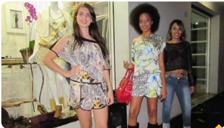
Modelos desfilaram as tendências da moda

Um grande público prestigiou o evento realizado pelas lojas Salto Chique e Sem Juízo