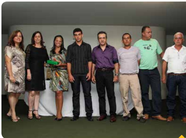
Equipe da Matoso durante a formatura

A Matoso Indústria e Frigorífico participou do Programa de Formação de Lideranças