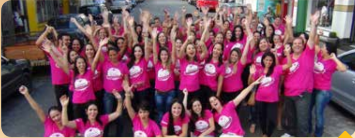
Empresários envolvidos no projeto

Uma nova campanha movimentará todo o comércio localizado no final da tradicional Rua Benedito Valadares