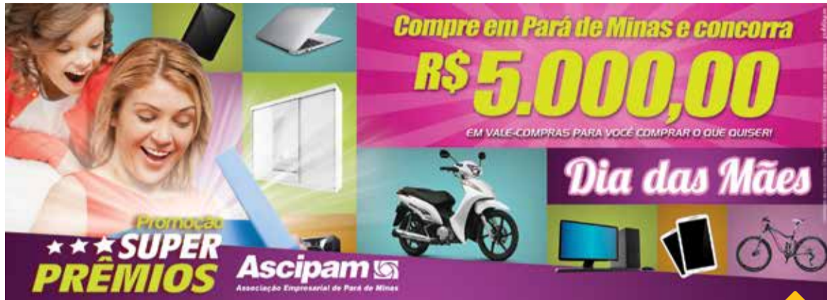
Anúncio publicitário da campanha

Promoção vai premiar consumidores e vendedores com vales-compras durante todo o ano