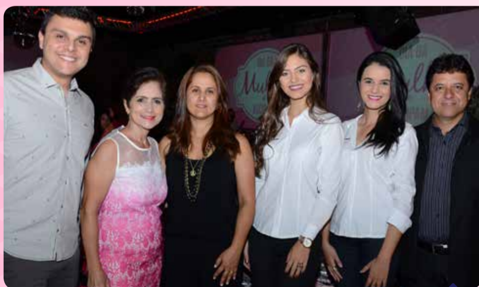
Os diretores junto às colaboradoras da Ascipam